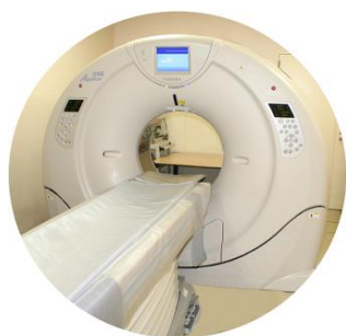
320列マルチスライスCT